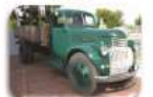
1941 Chevrolet Truck R295 000

Our Showroom/Workshop is at 70, Main Road, Knysna (N2) We buy & sell all makes of classic, sports & vintage cars and motorcycles. Consignment sales welcome.