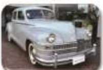
1948 Chrysler Windsor R160 000