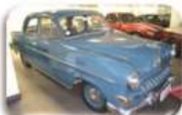
1954 Opel Kapitän – R88 000