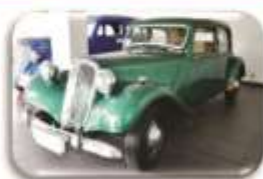
1955 Citroen – R88 000