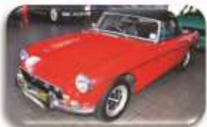
1972 MGB Roadster – R115 000

Our Showroom/Workshop is at 70, Main Road, Knysna (N2) We buy & sell all makes of classic, sports & vintage cars. Consignment sales welcome.