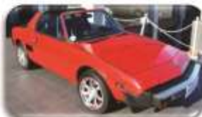
1979/80 Fiat X1/9 – R95 000