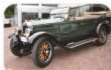
1926 Buick Phaeton R488 000