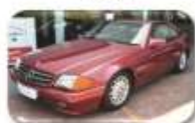
1993 Mercedes Benz 500SL R198 000