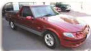
1988 Ford Ranchero – R130 000