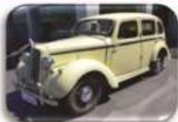
1939 Hillman Minx – R85 000